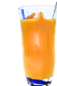
マンゴージュース (フローズンマンゴー入り)

ristorante il mare イルマーレ Lunch 11:30~14:00(L.O13:30)