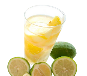
上島町のレモン使用 チューハイフローズンレモン