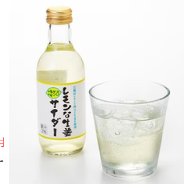
上島町岩城島のレモンを使用 レモンな生姜サイダー (フローズンレモン入)