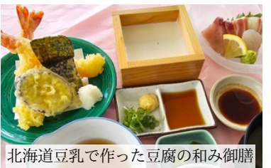
北海道産豆乳で作った豆腐の和み御膳 (天婦羅・お造里二種・手作り豆腐)