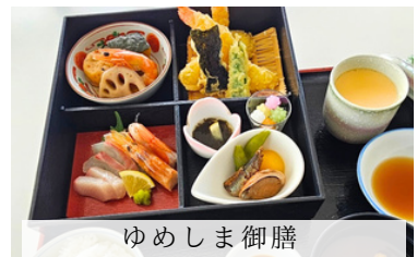
ゆめしま御膳 (海老天婦羅・造里三種・煮物・口取り・茶碗蒸し)