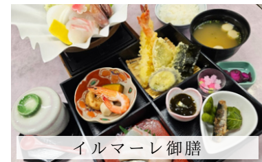
イルマール御膳 (海老天婦羅・造里三種・煮物・口取り・茶碗蒸し・火の物)

ristorante il mare イルマール Dinner 17:30~21:00(L.O20:00)